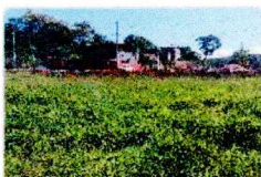
vista fundos do imóvel