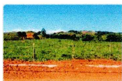
Vista frente do imóvel