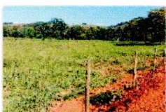
vista diagonal esquerda do imóvel