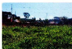
vista fundos do imóvel