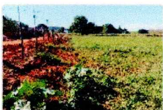
vista lateral do imóvel