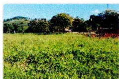
vista fundos do imóvel