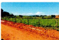
vista diagonal direita do imóvel